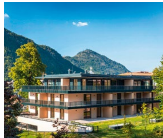
Die Villa Iscala in Bad Ischl beherbergt 16 Wohnungen.